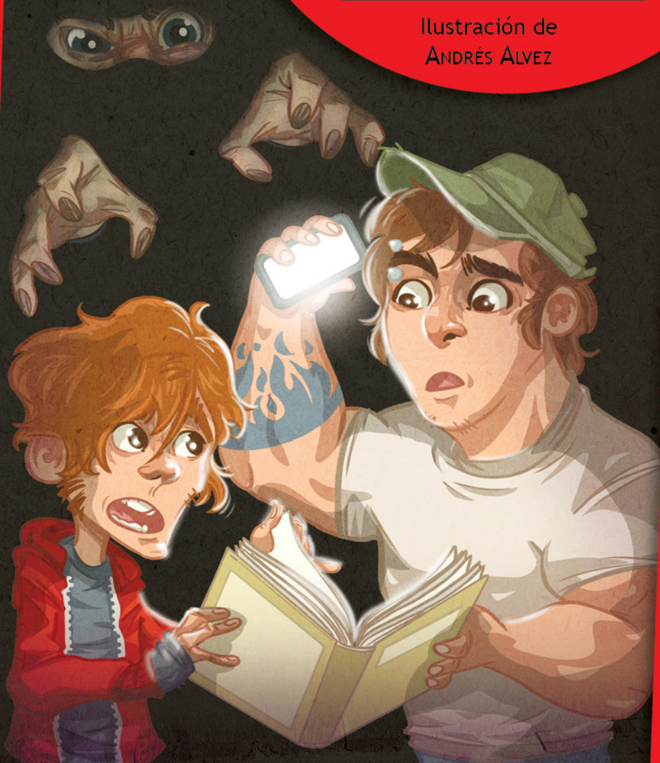
Ilustración de ANDRÉS ALVEZ